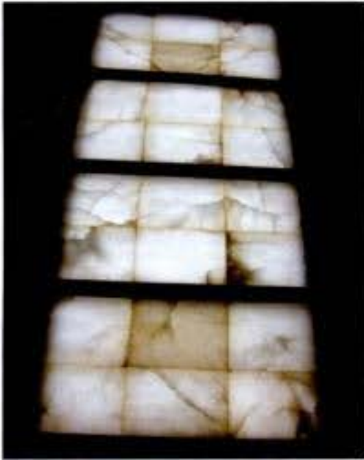
Ventana de alabastro en el Monasterio de Piedra, Aragón, España.